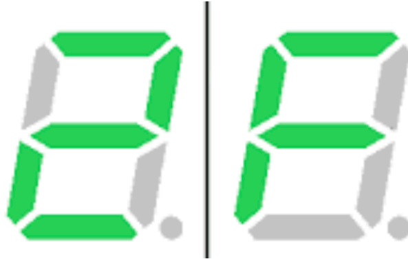
ตัวอย่างการแสดงผลของจอภาพในระบบ Seven Segment

'#' ในตำแหน่งบิตที่มีค่าเป็น 1 ของ v_i เช่น ถ้า v_i มีบิตที่แทนเซกเมนต์ A B D E และ G เป็น 1 (ดังภาพซ้าย) จะได้รูปเลข "2" ส่วนถ้า v_i มีบิตที่แทนเซกเมนต์ A E F และ G เป็น 1 (ดังภาพขวา) จะได้เป็นรูปตัว "F"